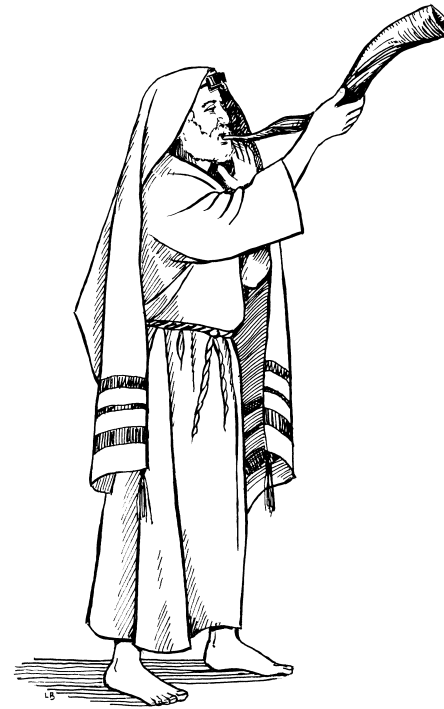
Usaraŋjal bí búñ upija yinŋu (6.4)

Joosuwa yíiñ bisaraŋjaliibi ki bí-bi yíi: «Ydōmmaan Dipoondi dakaau kí búkuñ ní bisaraŋjaliibi biluli ḡ nín ḡúb ipijaa yinŋyi ki lī ti-Dindaan dakaau nyɔkɔpu.» 7 Ní u bí samaa yíi: «Yíkìmaan kí cōom kí mǎntí tū kitiŋ, bijanjaliibi bin lǐnti nsanee ḡ lǐnti ti-Dindaan dakaau nyɔkɔpu.» 8 Joosuwa nín tükü samaa yíi bí ḡá puee, mín ní bi ḡá. Bisaraŋjaliibi biluli bin nín ḡúb ipijaa yinŋyi ti-Dindaan nimbiinee lǐnti ki búñ ní ti-Dindaan Poondi dakaau pá bi-boon. 9 Bijanjaliibi bin lǐnti nsanee lī bisaraŋjaliibi bin búñ iyinee nyɔkɔpu, ní bijanjaliibi bin pǎantí boonee pá Dipoondi dakaau boon. Ní báa ḡma cōom ki cá ní iyin búñ.