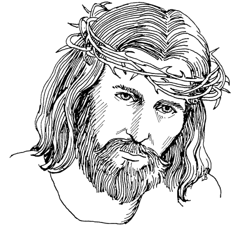
ki dū ikun̄kum ki l̄un̄ kibeefulii ki cíkiñ-u (15.17)

16 Niinee, soojab cáá Yeesu ki k̄on̄ ḡomina cindi poon ní ki ȳiñ disoojakitil din kínee k̄oɔ. 17 Ní bi dū dib̄okutimandi cínc̄iñ ki p̄ēh Yeesu, ní ki dū ikun̄kum ki l̄un̄ kibeefulii ki cíkiñ-u. 18 Bi n̄n kíi ki jáam̄-u yii: «Ti jáam̄-si Juuda yab b̄otiu!» 19 Bi cáá n̄kpan̄do ki