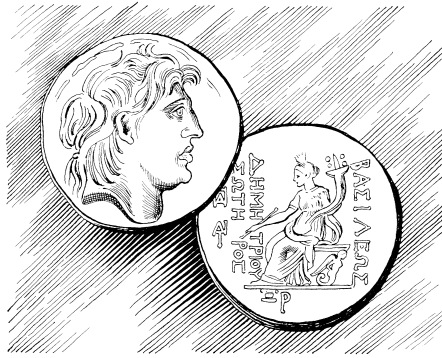
Diyindi nì diyil din ká animbil puee (20.24)

19 Niinee, bimaradakaliibi nì bisaraanɲakpilib bí nyàab isan kí cúú Yeesu, kun puee bi béè yii bín pu ní u dū tiboti gbanti ki ɲmánti, ama binib nín nìn wíki u-cee puee, bi fāŋki. 20 Ní bi kíí ki bíi cōŋkí Yeesu ní ki nyánti binib biba ki túnni u-cee, bi dū bi-ba ki gíi nīmōntiyaamin kí píí-u tiboti bí ɲmā kí cúú-u kí dūu ɲúbiñ gōmina ń dāal u-tafal. 21 Ní binibee bālifi Yeesu yii: «Ukpil, ti nyí yii tin a sòoñee nì tin a dākèe bí deedee, bāa unil yaa yānti ki bí miŋyee, aa fātii tó, ní ki dākà nimbōtisan nì ibaamōn. 22 Mín puee, á tükù-ti, ti-marau pú-ti nsan yii tí pà lampoo kí tū Room gōminauaaa, an kaa pú?» 23 Yeesu béè bi nín bíi líbití-uee ní ki bí-bi yii: 24 «Cáaŋmaan-mi animbil.» Bi cáañee, ní u bālifi-bi yii: «Ŋma yindi nì u-yil di ká animbil pu na?» Ní bi kíí-u yii: «Gōmina Seesar.» 25 Niinee ní u fātii bí-bi yii: «Dūmaan tin gōmina