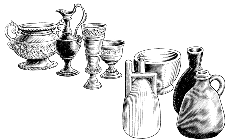
Sindaariya nì animbil kúti boonñi (2.20)

20 Dicijnpaandinee, an kaa sá sindaariya nì animbil kúti boonñi baba di bí, ama aboon ñin bi máñ nì kuyòkòuee nì itúun mun bí. Sindaariya nì animbil kúti boonñi yú ki cí iwijnpaan dal ní, ní itúun nì aboon ñin bi máñ nì kuyòkòuee sá báa ñma ñ nìn cáa ñáañ min u lèe. 21 Un yaa fá ikpiti in bóti m sòoñee kpánti umónti dee ki sá kii sindaariya boonñi ñin yú ki cí iwijnpaane. Di sá yii u bí ki tñi u-kpiliu an kòkò pu ú dü-u kí tó atummónti.